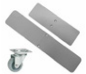
piéd plats avec ou sans roues